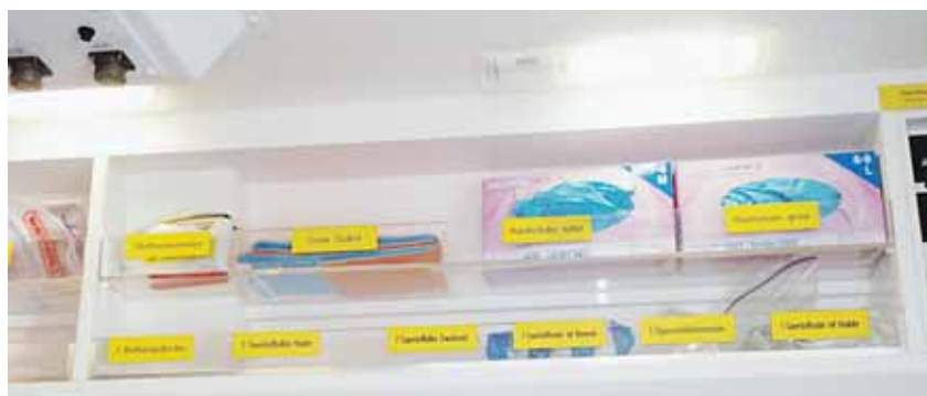
Die Ordnung in der Ambulanz, wo die Medikamente und Utensilien versorgt sind.