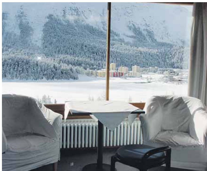
Diese schöne Aussicht geniessen die Patienten im besten Zimmer Nr. 33.